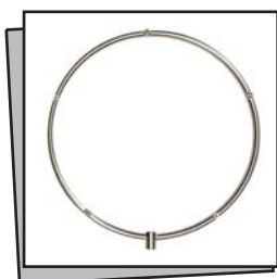
Ghiera portaugelli 5 fori - Misting ring 5 Holes