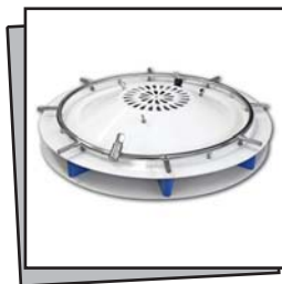
Nebulizzatore radiale a sospensione - Ceiling radial Mist fan

La ventilazione come diffusore per la nebulizzazione diventa un elemento indispensabile per sistemi in ambienti interni o semi-aperti, per locali pubblici quali bar, discoteche o ristoranti, per il noleggio o le grandi manifestazioni.