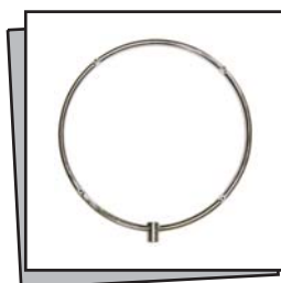
Ghiera portaugelli 4 fori - Misting ring 4 Holes