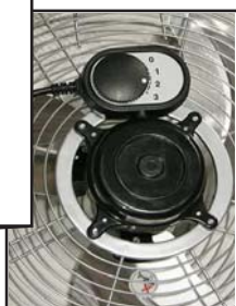
Ventilatore industriale a sospensione - Heavy duty Hanger fan