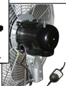
Ventilatore industriale per montaggio a parete - Heavy duty Wall Mounting fan