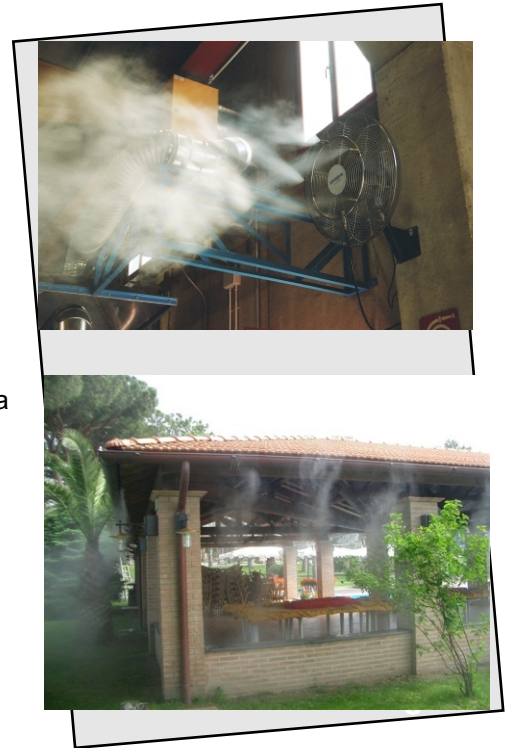
Millions of less than 10 microns droplets sprayed by our fog nozzle.

Queste goccioline ultra fini, evaporando, assorbono rapidamente l'energia (calore) presente nell'ambiente circostante e diventano vapor acqueo (gas). L'energia (calore) impiegata nella trasformazione dell'acqua in gas è sottratta all'ambiente, determinando così un abbassamento di temperatura dell'aria.